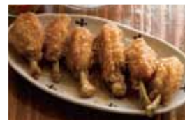
杏恋(串かつ・居酒屋)