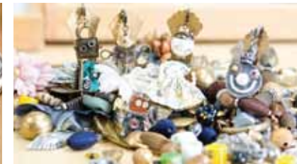
パーツの中から生まれてきます。